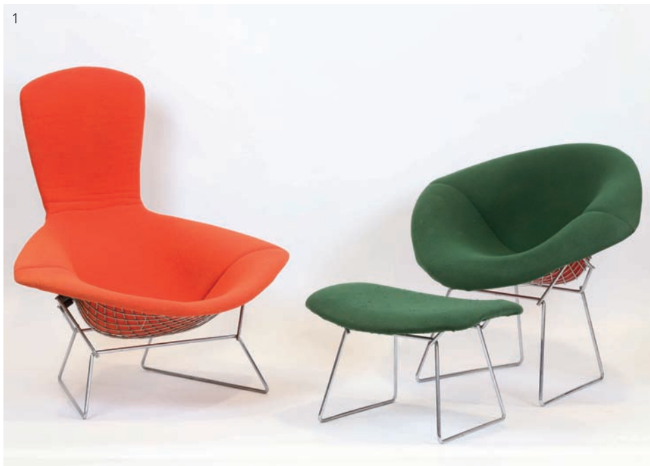
1 Harry Bertoia pour Knoll International, éditions vintage. - Fauteuil Diamond 200/400 euros - Fauteuil Bird 600/800 euros - Ottoman 150/200 euros