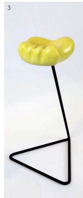
3 Georges Jouve (1910-1964) et Mathieu Matégot (1910-2001) cendrier "Patte d'ours" circa 1955. Dim : 9 x 19 x 17 cm. Hauteur du piètement : 56 cm. Estimations : 2000/4000 euros