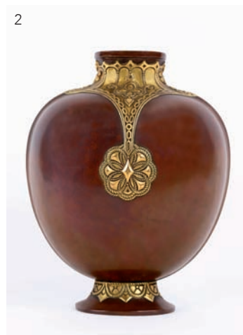
2 Christofle, dinanderie, vase gourde de la ligne L'Inéa en bronze. H : 25 cm, l : 19 cm. * Estimation : 800/1200 euros