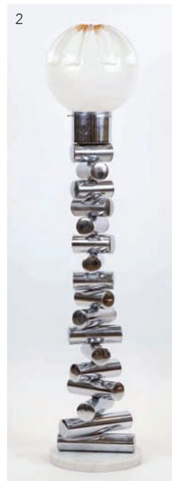
2 Mazzega, Italie, lampadaire chromé et verre de Murano. Années 1960. Hauteur : 145 cm. Estimation : 400/500 euros