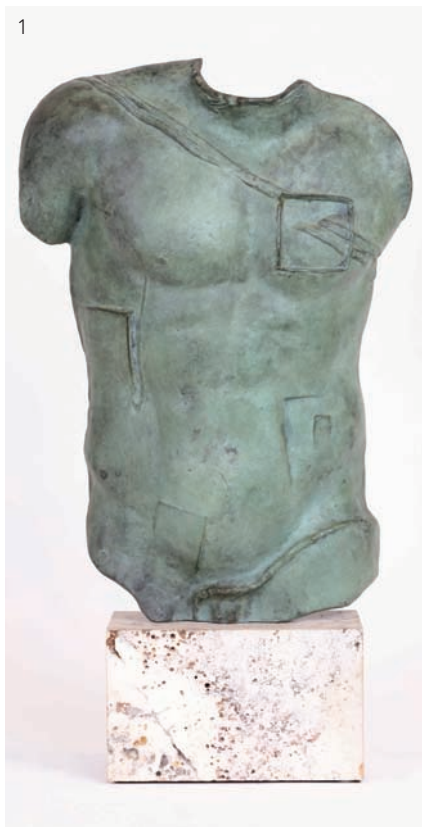
1 Igor Mitoraj (1944 -2014) "Persée", buste en bronze. Hauteur avec socle : 48 cm. Estimations : 2500/3500 euros