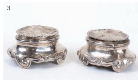
3 Paris 1766, Maître-orfèvre Alexis MICALLEFF paire de salerons en argent. Epoque Louis XV. Poids total 193 g. Dim : 5 x 8,5 x 7 cm. Estimation : 600/800 euros