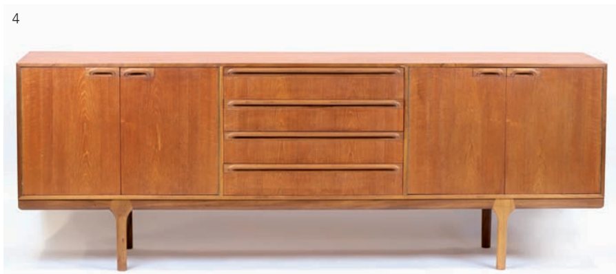
4 Tom ROBERTSON (XXe) pour McIntosh. Enfilade en teck. Années 1960. H: 76 cm, l: 213,5 cm, p: 45,5 cm. Estimation : 500/700 euros