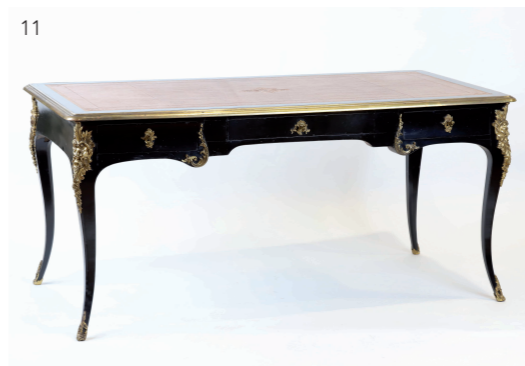
11 Maillefert, Orléans. Bureau plat en bois noirci et ornementation de bronzes dorés. Dans le goût du XVIIIème siècle. H: 76 cm, L: 160,5 cm, P: 81 cm. Estimation : 500/700 euros