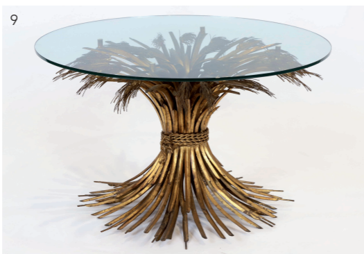
9 Table de salon aux épis de blé d'après Robert Goosens, modèle dit «Coco Chanel». H: 47 cm, diam: 80 cm. Estimation : 500/700 euros