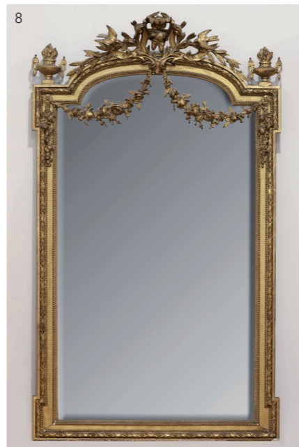
8 Important miroir en bois et stuc doré au putto et aux colombes. XIXème siècle. Dim: 220 x 127 cm. Estimation : 800/1200 euros