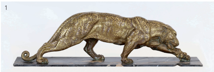
1 Demeter Chiparus (1885-1947) «Panthère se léchant la patte», bronze. Signé. Edition Reveylolis Paris. Circa 1930. Dim du sujet: 20,5 x 71 cm Estimation : 5000/7000 euros