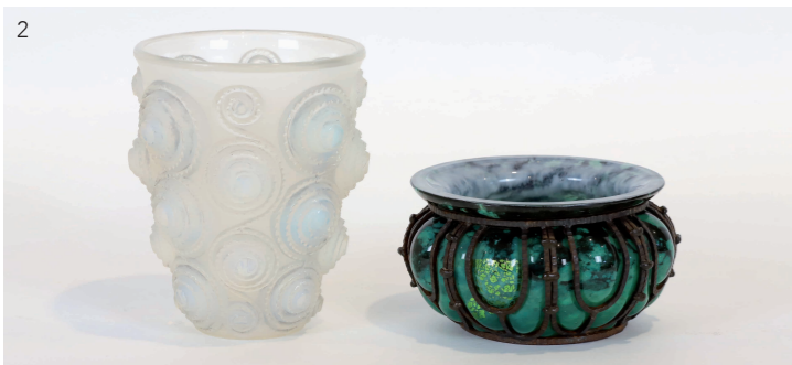
2 René Lalique vase «Spirales». H: 17 cm Estimation : 500/700 euros Daume Nancy & Louis Majorelle. H: 9 cm Estimation : 300/400 euros