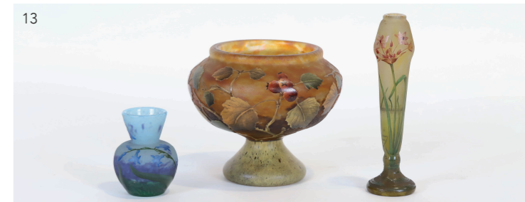
13 Daum Nancy, circa 1900, vases en verre multicouches. H: 18,5 cm. 300/400 euros H: 15 cm. 300/500 euros H: 18,5 cm. 300/400 euros